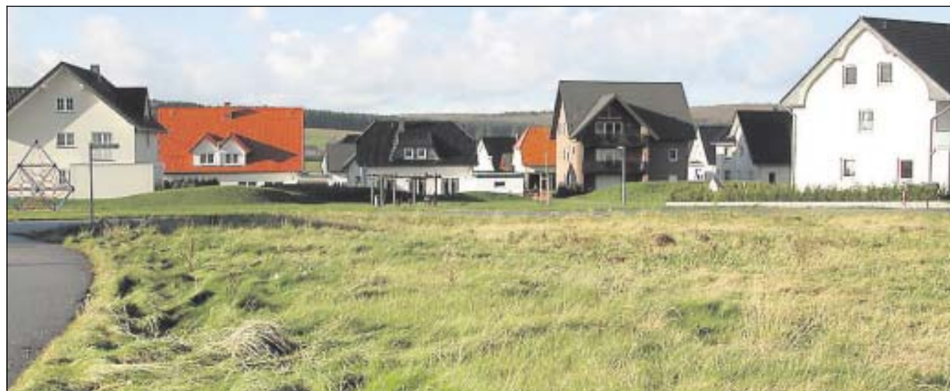
So sieht es aus: Auf der freien Fläche eingangs des Heinrich-Gudemann-Ringes im Warsteiner Baugebiet St.-Poler-Straße III sollen die Roreger-Häuser entstehen. Die Gärten weisen zur hier sichtbaren, bereits bestehenden Bebauung.